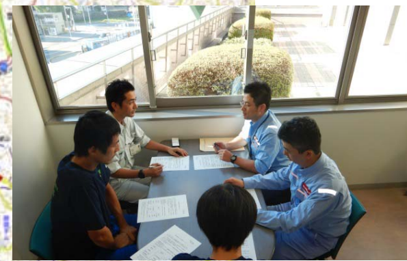
熊野町における説明状況