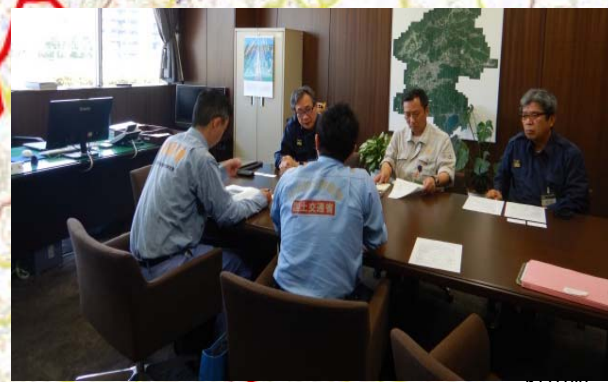
東広島市における説明状況