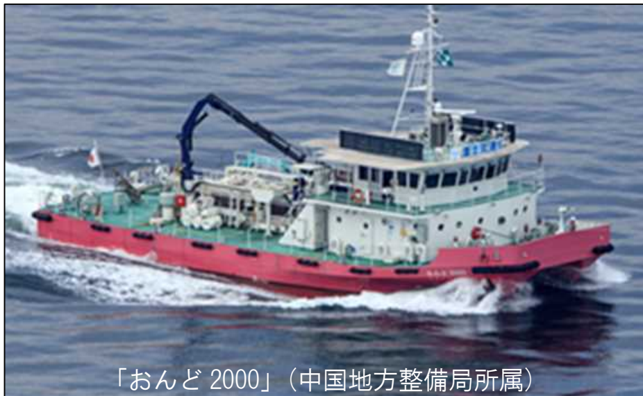
「おんど2000」（中国地方整備局所属）

また、呉港の港湾管理者である呉市からの要請に基づき、全国で初めて港湾法五十五条の三の三の規定の適用により、非常災害の場合における国土交通大臣による港湾施設の管理として、7月16日より呉港内の漂流物の回収も行っております。