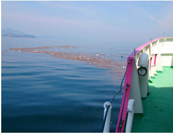
漂流物の状況(下蒲刈沖付近)