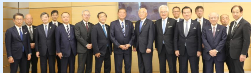
中国地方国際物流戦略チーム有志一同による政府への要望活動状況(R6.11.27)