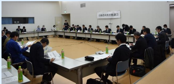
利用者の声を聞き、物流の更なる効率化を目指します