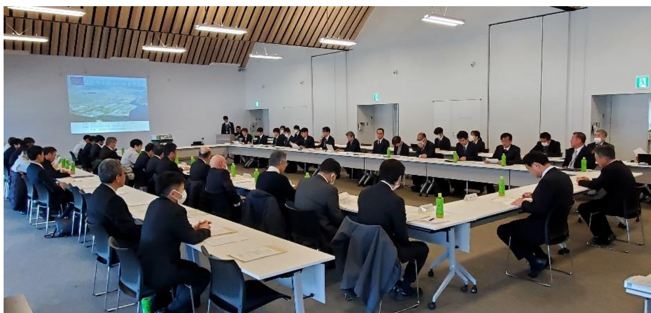
三田尻中関港利用者懇談会 開催状況