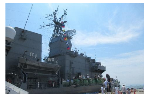
玉島ハーバーフェスティバル