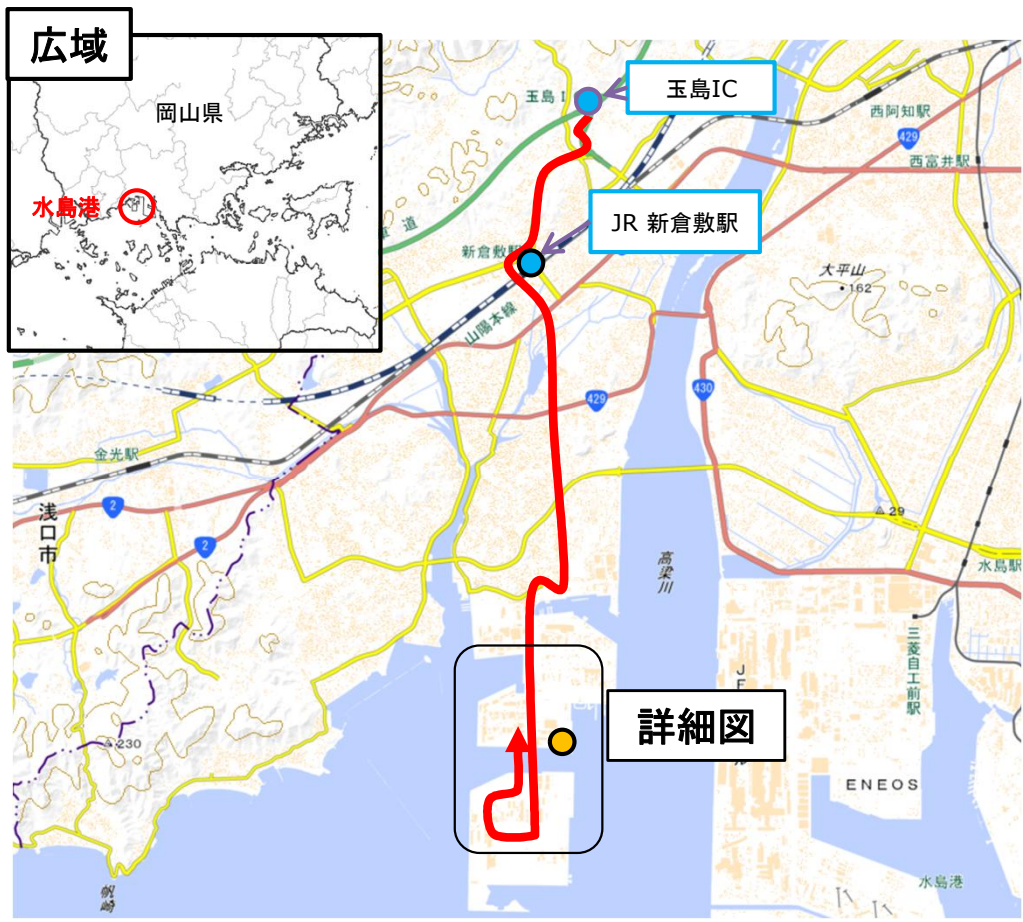
国土地理院地図（電子国土Web）( https://maps.gsi.go.jp )をもとに作成