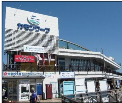
構成施設のイメージ (下関港、カモンワーク)