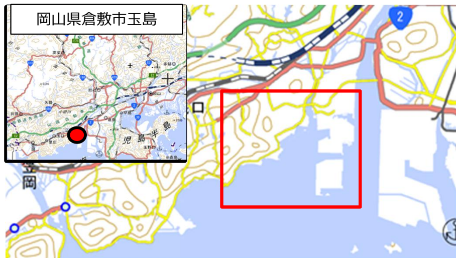
国土地理院地図（電子国土Web）( http://maps.gsi.go.jp )をもとに作成