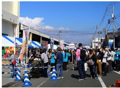
地域振興イベントの開催状況 (Sea級グルメ全国大会in沼津)