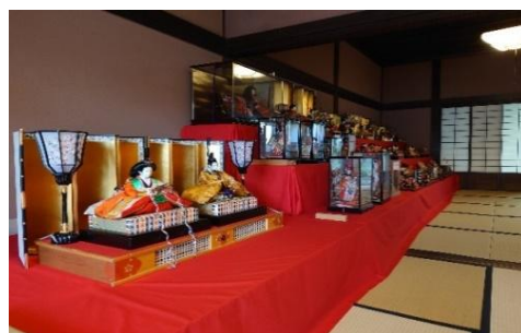
倉敷雛めぐり(玉島地区)