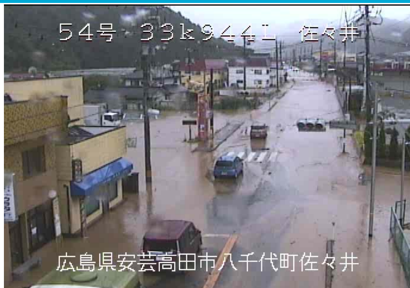
広島県安芸高田市八千代町佐々井