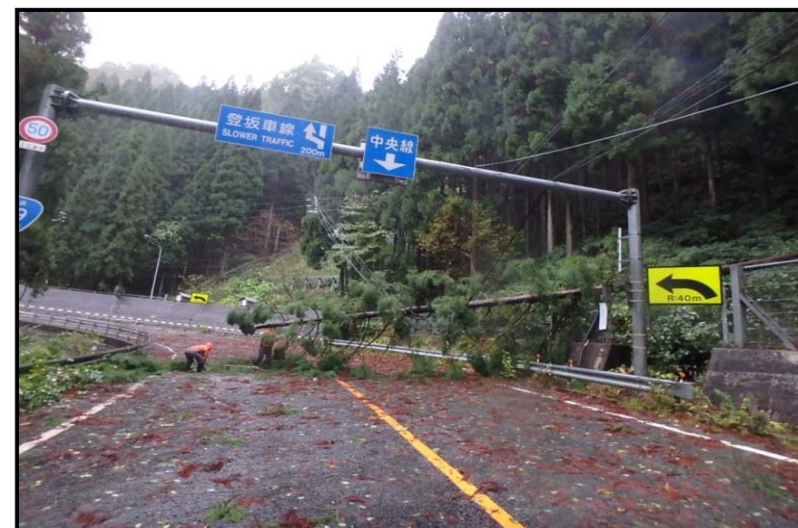
暴風による倒木 国道29号 鳥取県八頭郡若狭町落折 平成29年10月23日