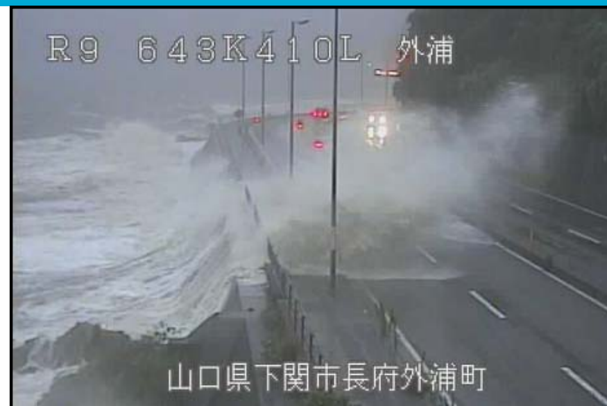
山口県下関市長府外浦町