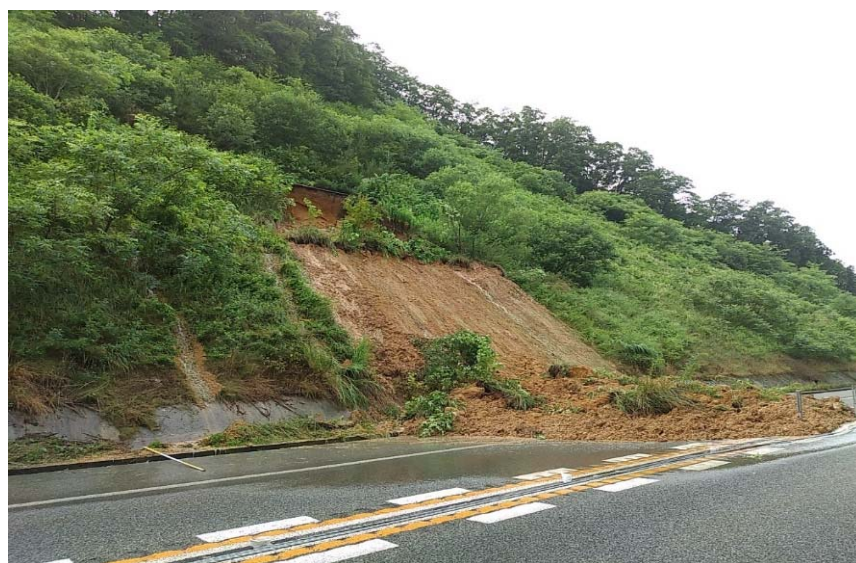
大雨による法面崩落 松江道 広島県庄原市高野町 令和3年7月12日