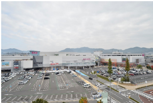
協定締結により災害時に提供する施設例 (イオンモール広島府中：安芸郡府中町)