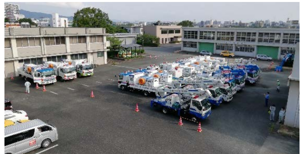
全国から集結した災害対策機械