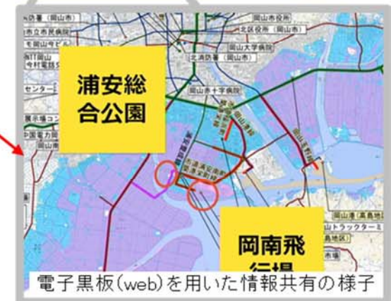
電子黒板(web)を用いた情報共有の様子