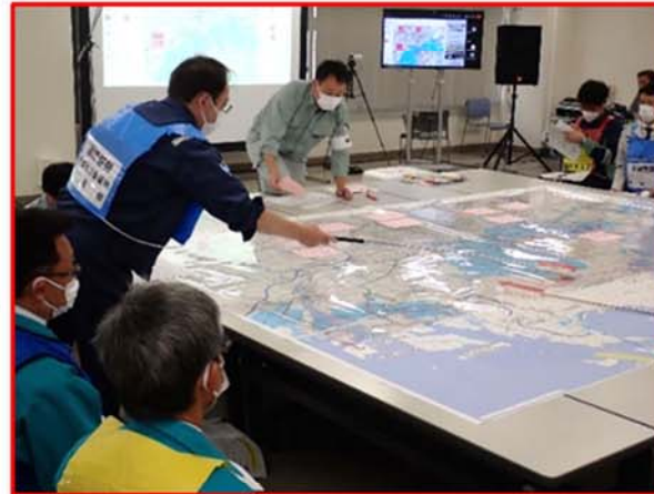
大判図面を用いた訓練(啓開作業進捗調整)の様子