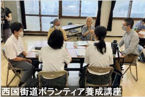
西国街道ボランティア養成講座