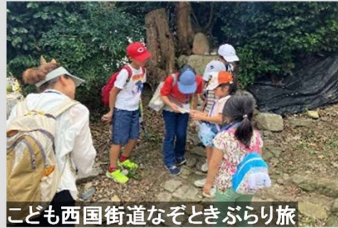
こども西国街道なぞときぶらり旅