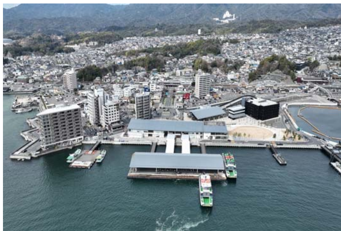
宮島口周辺（廿日市市）