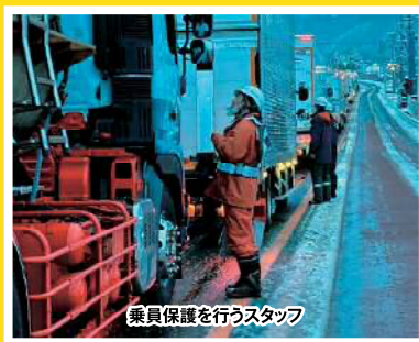
令和7年3月 山梨県内国道20号における 車両滞留の発生状況