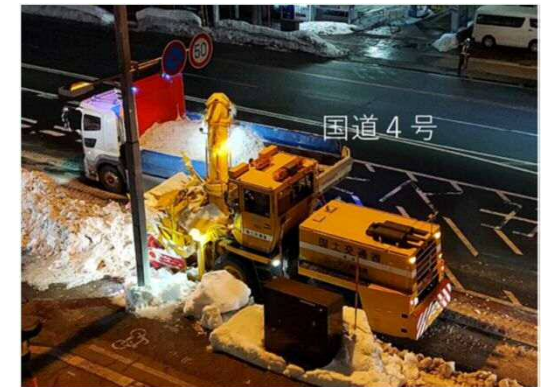
▲過年度のスクラム除雪実施状況（青森県）