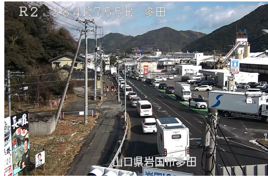
国道2号の車両混雑状況<令和8年1月3日>