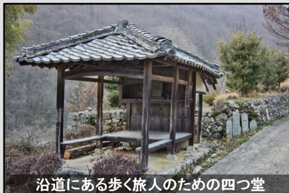
沿道にある歩く旅人のための四つ堂