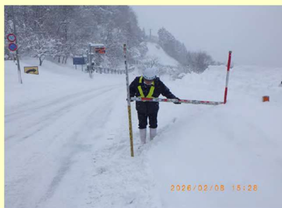
道路巡回 (鳥取県八頭郡智頭町)