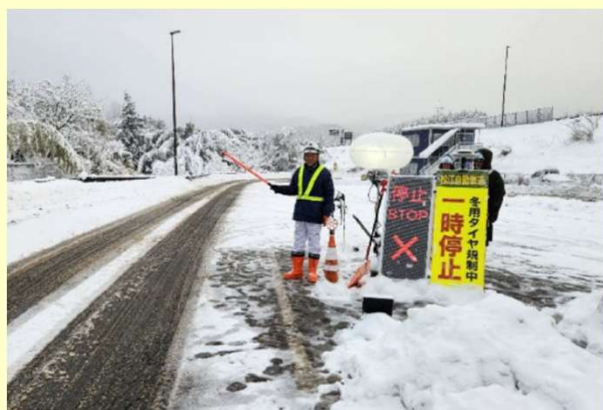
タイヤチェック (広島県三次市)