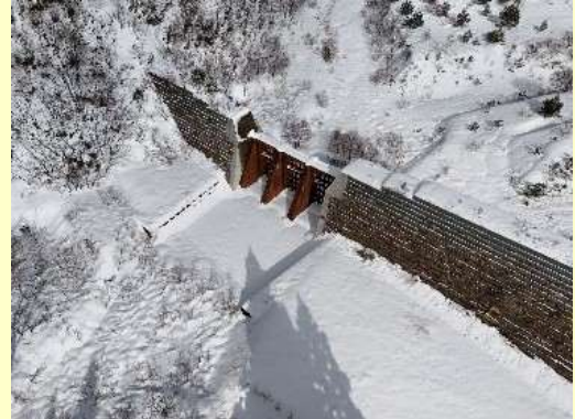
ドローンによる砂防施設の臨時点検 (鳥取県日野郡江府町)