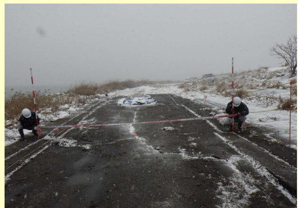
堤防の被災状況調査 (島根県松江市)