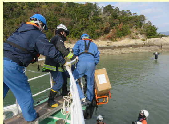
できるだけベースキャンプに近い岩場に接岸、錨泊を判断し、資器材の荷役を安全かつ円滑に実施