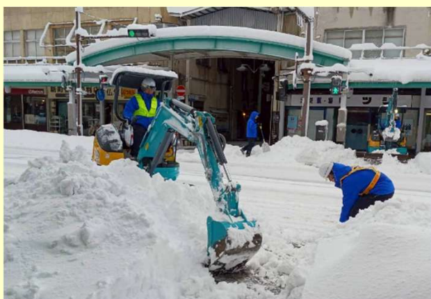
除雪作業 (鳥取県鳥取市)