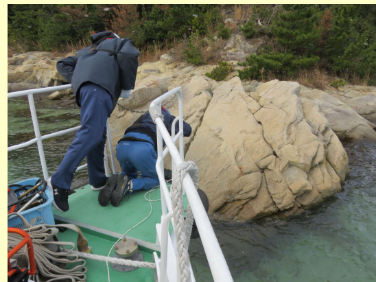
レッド測量により水深を確認