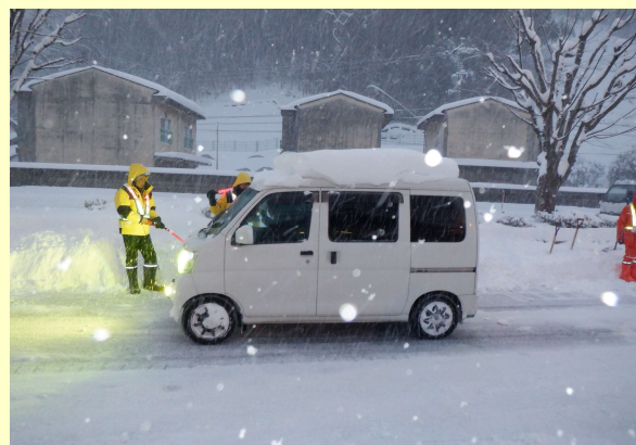
タイヤチェック (島根県雲南市)