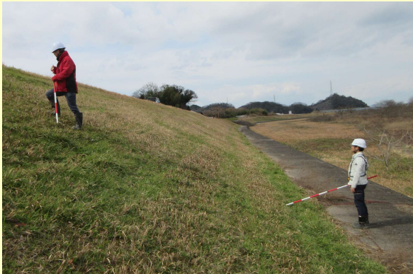
河川堤防の緊急点検 (鳥取県米子市)