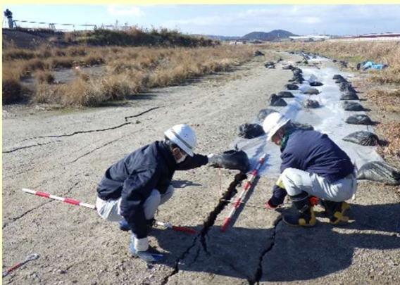
堤防の被災状況調査 (島根県松江市)