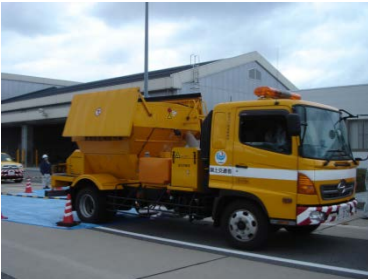
凍結防止剤散布車