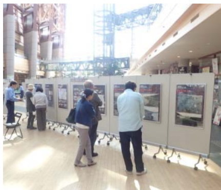
過去のパネル展示状況

過去の開催の実績 令和元年5月12日～17日 会場: 倉吉未来中心 来場者数: 約900人