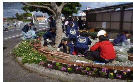
第1回目活動 (H31.4.27) 花植状況

参加者：「ボランティアロード車尾」会員 約200名 (鳥取県、米子市の職員も参加します。)