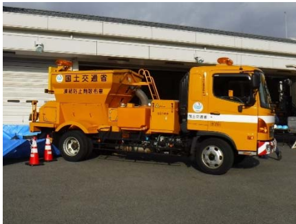
凍結防止剤散布車 （凍結防止剤散布実演予定）