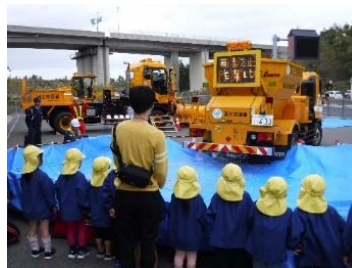
凍結防止剤散布実演