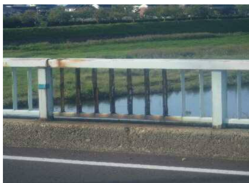
新天神橋 防護柵(更新前)