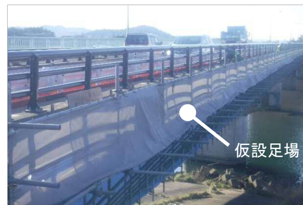
工事で使用した仮設足場を撤去します。