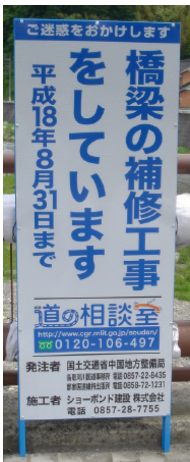
国道53号京橋他橋梁補修工事の工事説明看板 八頭郡智頭町智頭地内