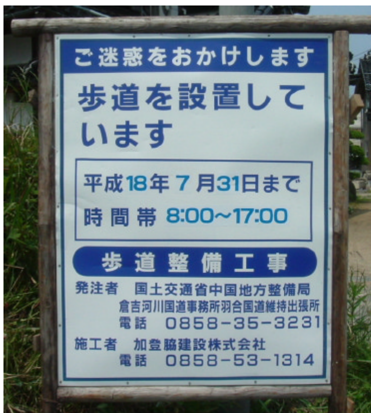
国道9号八幡坂歩道整備工事の路上工事看板 東伯郡琴浦町赤碓地内