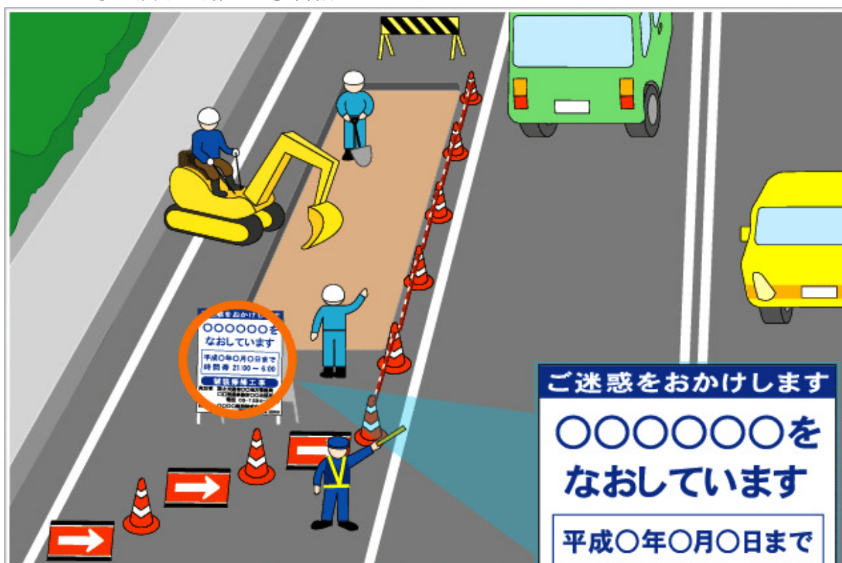
・全景 及び 路上工事看板

新しい路上工事看板のデザインは、道路利用者の皆様に読みやすくなるよう、多くの皆様の声や有識者のご意見を参考に決定しました。