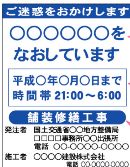
新しい路上工事看板（工事中看板の例）

何の工事を何の目的で実施しているかをわかりやすく示す「 工事内容 」を表示します