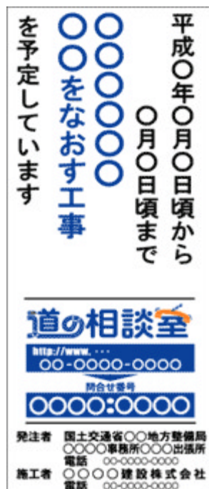
(工事情報看板の例)