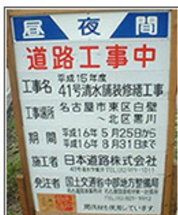
従来の路上工事看板

道路利用者にとって重要な情報をわかりやすく提供するため、次のポイントについて見直しを行っています。