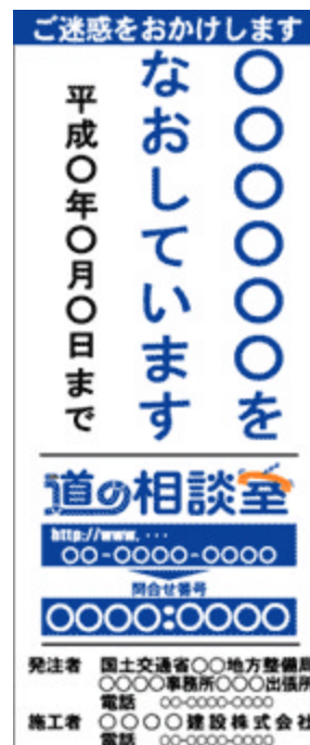
(工事説明看板の例)