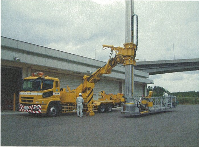
橋梁点検車 歩廊式

平成21年3月に新しく配備した 災害対策用機械です。 同型機が全国に15台あり、中 国地方整備局内で唯一の保有 となります。