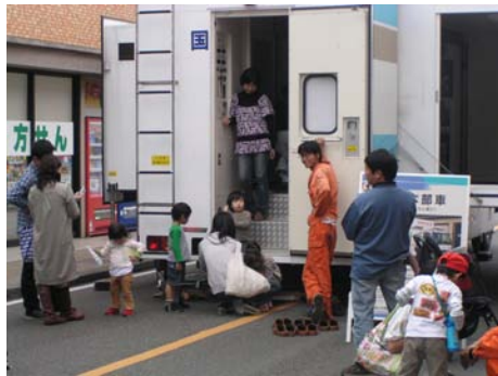
災害対策本部車の乗車体験の様子（イメージ）