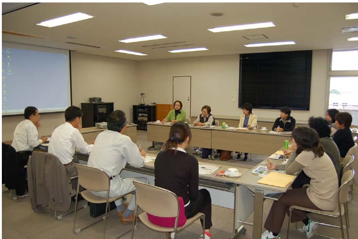
意見交換会の様様