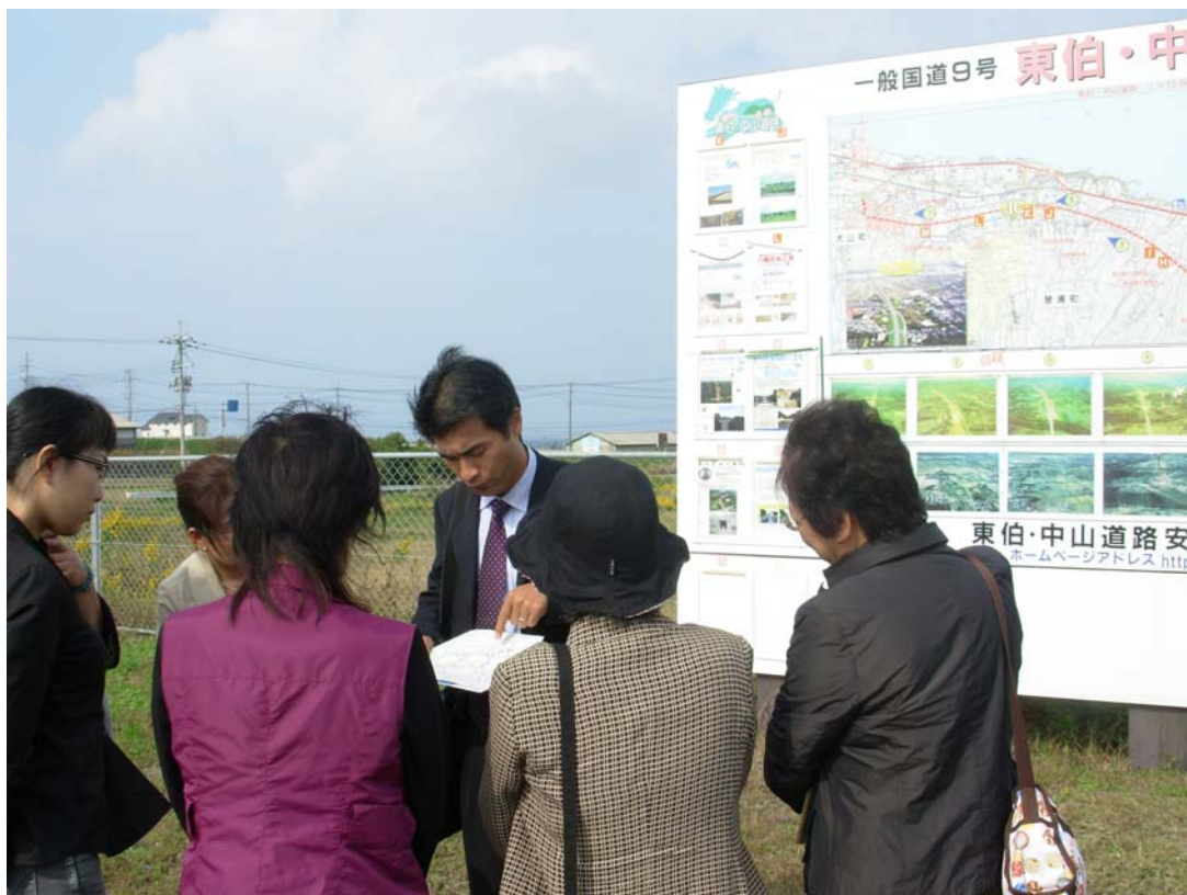
現場見学会の様様