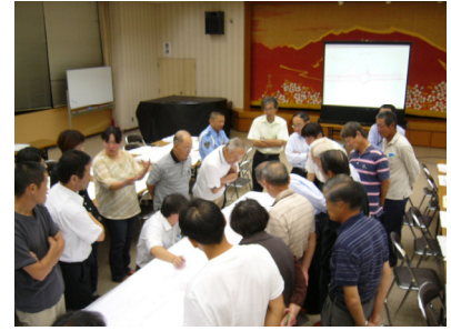
（第2回協議会の様子）

国道9号は地元住民にとって身近な生活道路となっていますが、大山町の塩津地区は、歩道の未整備区間や、3つの交差点が近接していることにより、事故の危険度の高い地域となっています。そこで、6月8日に地域住民の方と一っしょに交通安全総点検を実施しました。交通安全総点検での地元住民の意見を受け、より良い交通安全対策を実施するために、地元住民の意見をお聞きし住民参加のもとで改良計画を構築します。