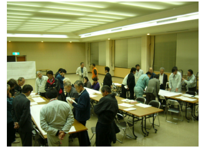
（第3回協議会の様子）

国道9号は地元住民にとって身近な生活道路となっていますが、大山町の塩津地区は、歩道の未整備区間や、3つの交差点が近接していることにより、事故の危険度の高い地域となっています。そこで、平成21年6月8日に地域住民の方と一っしょに交通安全総点検を実施しました。