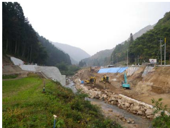
福本砂防堰堤工事状況