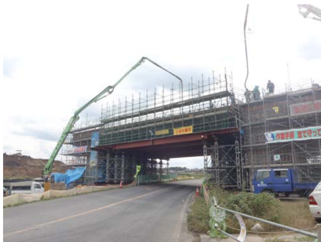
中山高架橋工事状況