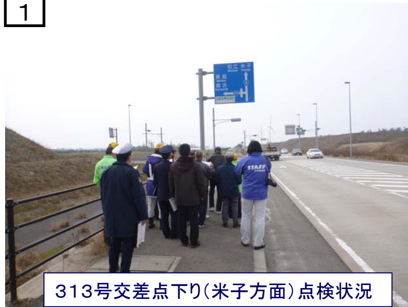
313号交差点下り(米子方面)点検状況