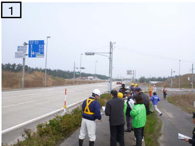
313号交差点上り(鳥取方面)点検状況