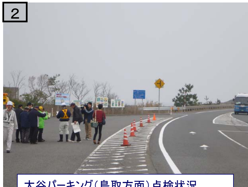
大谷パーキング(鳥取方面)点検状況