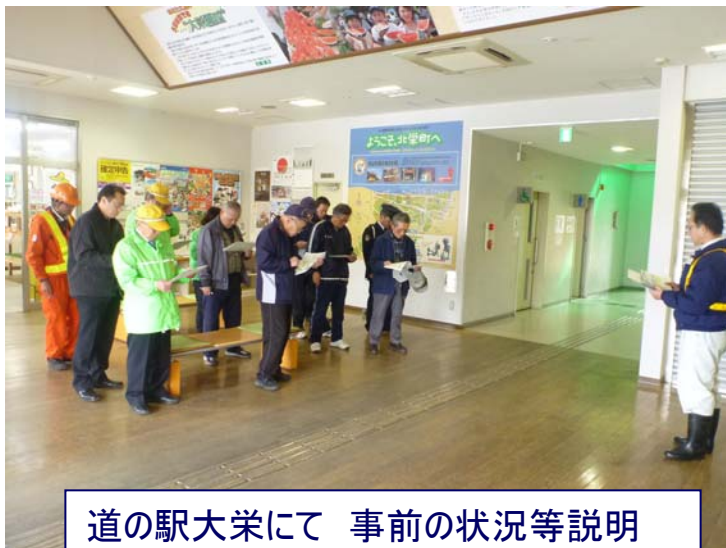
道の駅大栄にて 事前の状況等説明