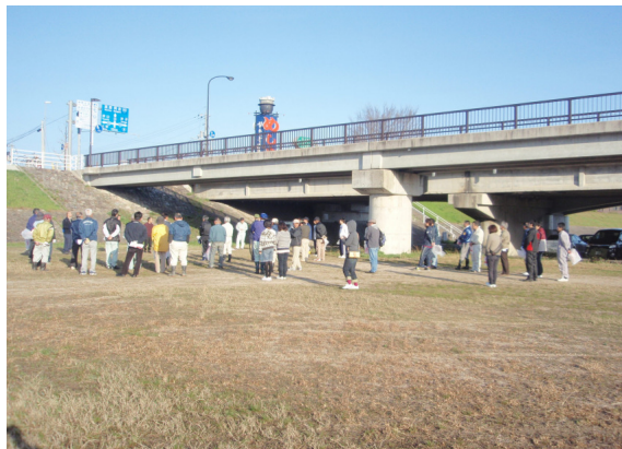
開始時の説明(竹田橋付近)