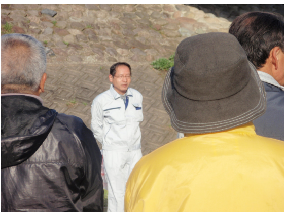
倉吉市長あいさつ