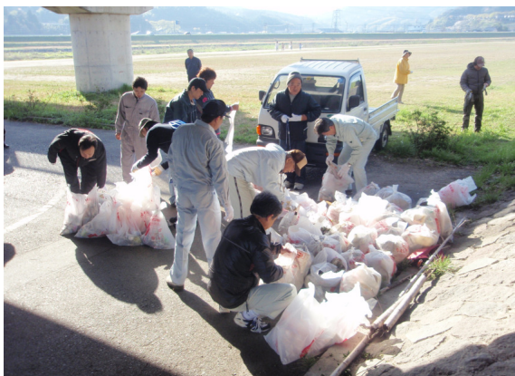
集められたゴミの袋