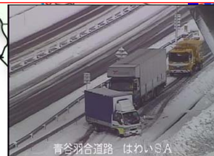
青谷羽合道路 はわいSA ①2011.12.23 16:45 青谷羽合道路 下りオフランプ道の駅はわい入口

凡 例 ⊗ スタック発生箇所 ( ) は台数 全て(7台)は、交通渋滞等の支障は発生していない。