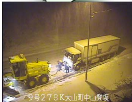
9号278K大山町中山登坂 ② 2012.1.24 2:40 国道9号 中山登坂