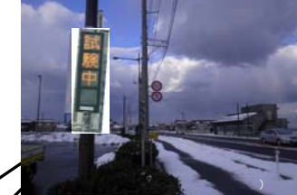
なかやまP (大山町田中)