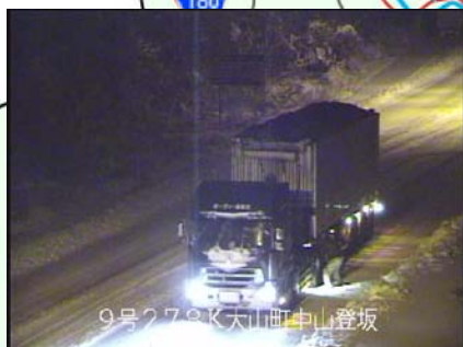
9号278K大山町中山登坂 ③2012.1.24 6:00 国道9号 中山登坂