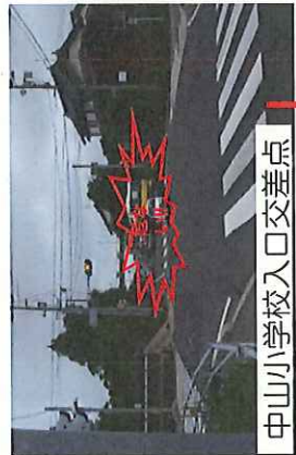
中山小学校入口交差点