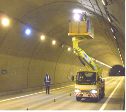
トンネル点検車にて点検作業(例)