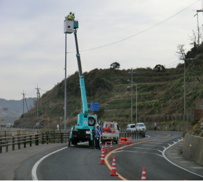
リフト車にて点検作業(例)