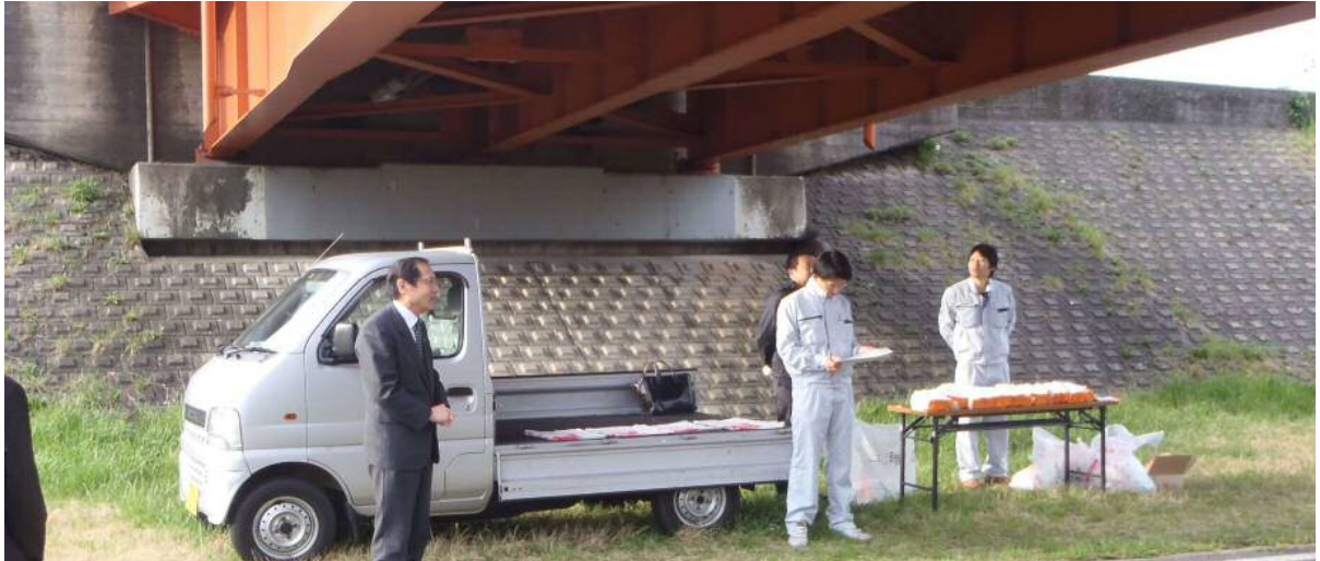
昨年の様子(倉吉市 三明寺橋下流) 平成26年4月20日(日)