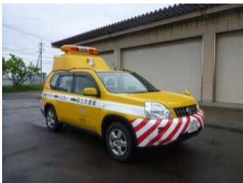
道路パトロールカー（試乗予定）