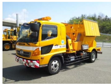
凍結防止剤散布車