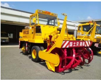
ロータリー除雪車