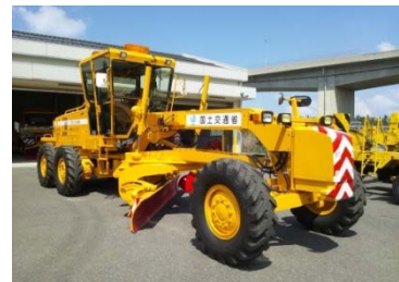
除雪グレーダ（試乗予定）