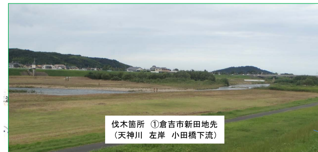
伐木箇所 ①倉吉市新田地先 (天神川 左岸 小田橋下流)

伐木箇所 ③倉吉市八屋地先 (天神川 右岸 竹田橋上流) 面積 18200m 2