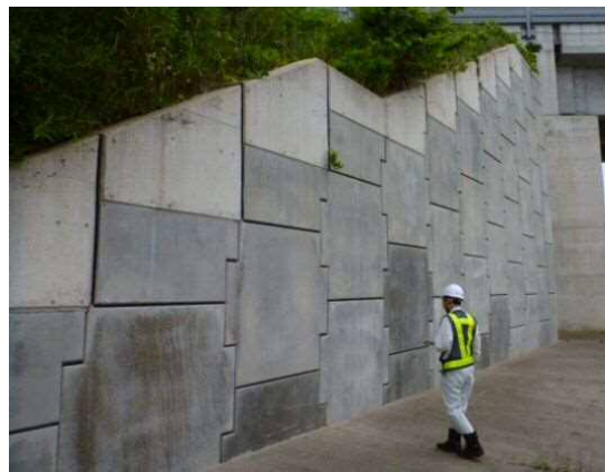
(写真) 補強土壁の状態を確認