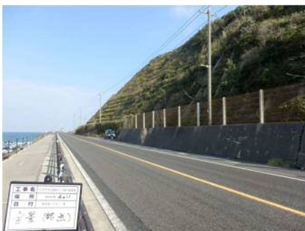
(写真) 点検対象のり面の例

倉吉河川国道事務所では、大雨などにより注意が必要となる道路のり面等の点検結果を、「 防災カルテ 」により経年的に整理し、管理しています。 今回の点検は、「 防災カルテ 」により管理している道路のり面の状況を中心に、国土交通省職員が点検し、 異状の発見および速やかな対策を講じることを目的としています。