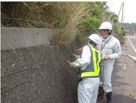
(写真) 道路のり面の状態を確認