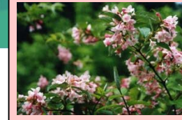
天神川の花 タニウツギ