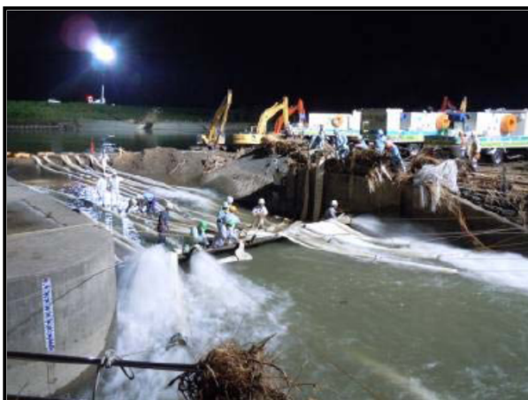
平成24年7月 九州北部豪雨災害 排水ポンプ車で内水排除作業