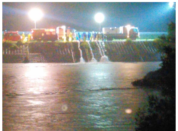
平成29年9月 鳥取県倉吉市 台風18号 排水ポンプ車で内水排除作業