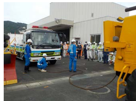
大型車両の牽引の様子