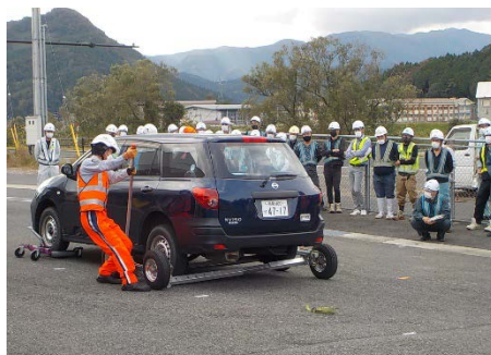
ポップアップドリーを使った 車両移動の実演