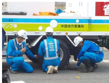
タイヤチェーン装着