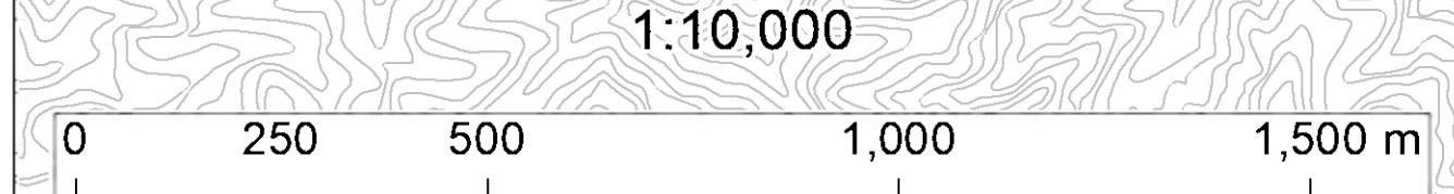
天神川水系三徳川洪水浸水想定区域図（家屋倒壊等氾濫想定区域（河岸侵食）（1/1））