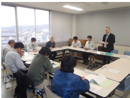
実行委員会の様子

天神川流域一斉清掃実行委員会は、天神川流域会議（当所HP参照）、鳥取県中部総合事務所、倉吉市、三朝町、湯梨浜町、北栄町及び国土交通省倉吉河川国道事務所が委員を構成し、天神川流域の住民のみなさんに天神川流域の清掃を呼びかけています。