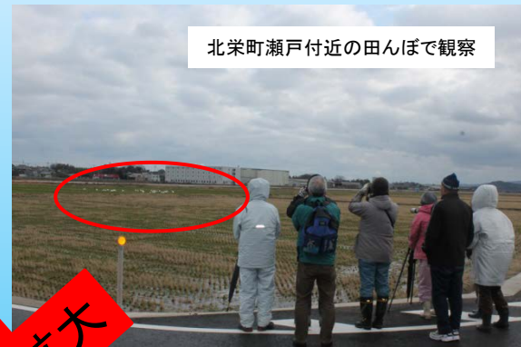
北栄町瀬戸付近の田んぼで観察

●湯梨浜町天神川桜つつみ公園付近の天神川にコハクチョウがねぐらとして30羽ちかく集まっています。コハクチョウは朝8時半ごろになると 家族単位で天神川を飛び立って、北栄町瀬戸付近の田んぼでエサを食べていました。