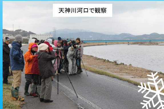
天神川河口で観察

●河口では20種類ぐらいの野鳥が2,000羽くらい集まっています。 マガモやウミネコなどいろいろな種類の野鳥について図鑑を見ながら特徴や見分け方を野鳥の会の方に教えてもらいました。