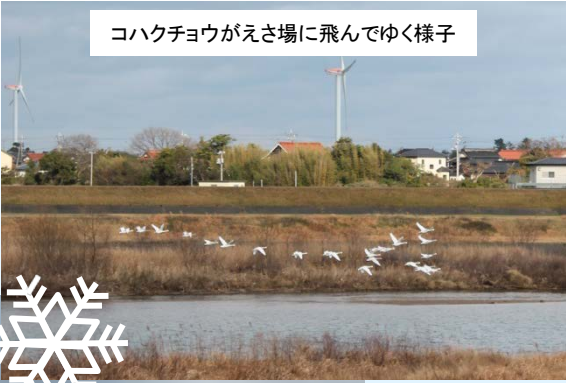
コハクチョウがえさ場に飛んでゆく様子