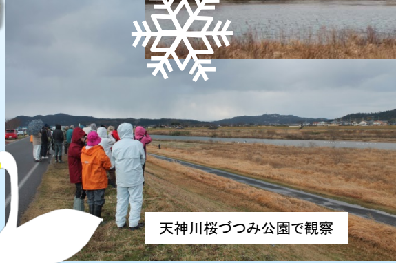
天神川桜つつみ公園で観察