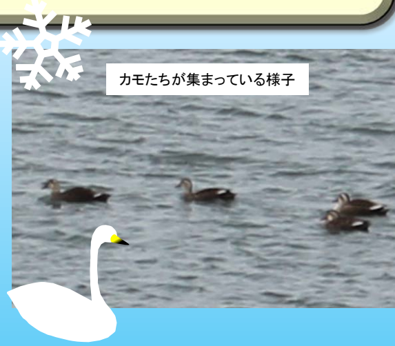
カモたちが集まっている様子

今回はコハクチョウが前回観察会と比べて数が3分の1しかいませんでした。 今年は全国的にコハクチョウの飛来数が減ったことと、この前まで4月上旬くらいの暖かさが続いたことで、いつもより早く帰ってしまったコハクチョウがいたためでした。