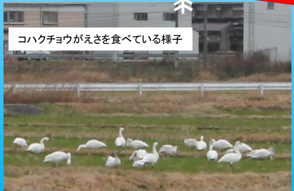
コハクチョウがえさを食べている様子