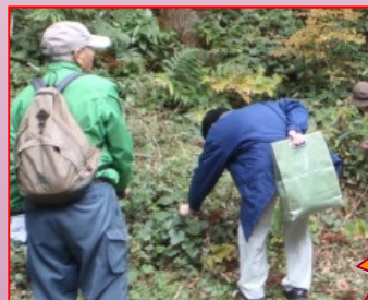
大山池・木の実の里