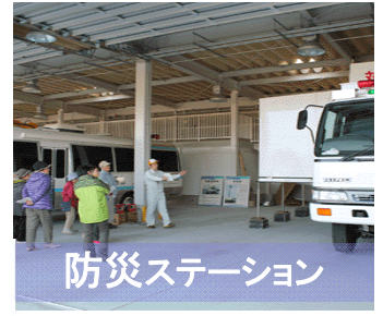
防災ステーション