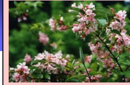
天神川の花 タニウツギ