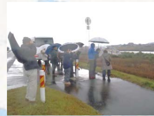
○コハクチョウがねぐらから飛び立つ様子を観察