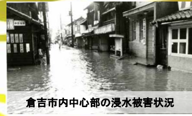
倉吉市内中心部の浸水被害状況