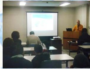
○天神川にいる生き物の説明