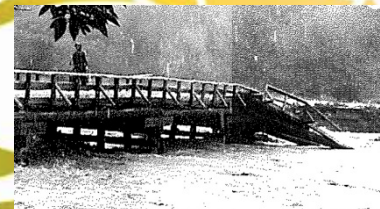
流出した今西橋(小鴨川)

5月12日(日)については、土石流を再現した模型の展示や土砂災害に関する3Dシアター等の企画も予定しておりますので、ぜひお越し下さい。