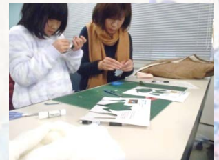
○野鳥のペーパークラフト工作