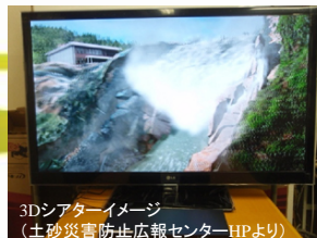
3Dシアターイメージ (土砂災害防止広報センターHPより)

5月12日(日)については、土石流を再現した模型の展示や土砂災害に関する3Dシアター等の企画も予定しておりますので、ぜひお越し下さい。