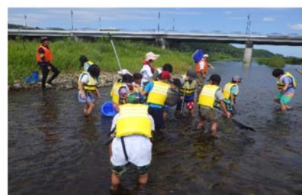
水生生物を採取中

期間中、子どもと父兄さん併せて延べ約100名が一緒になって川の中に入り、そこにいる生物や感想によって水質を判定してもらいました。その結果、天神川、小鴨川、北谷川はきれいな水と判定されました。