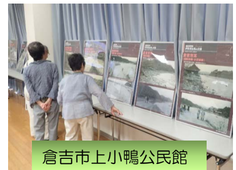
倉吉市上小鴨公民館