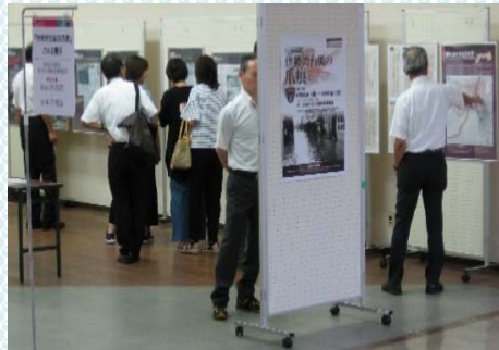
パープルタウン会場