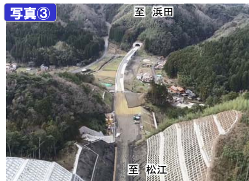
神西トンネル付近