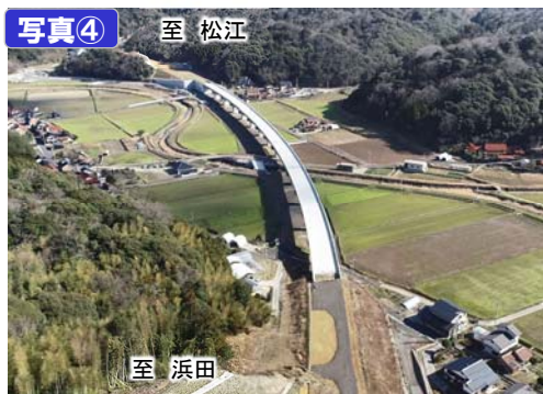
常楽寺第二高架橋付近