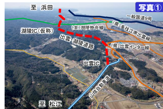
出雲IC付近から西を望む