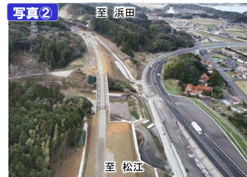
東神西第一高架橋付近