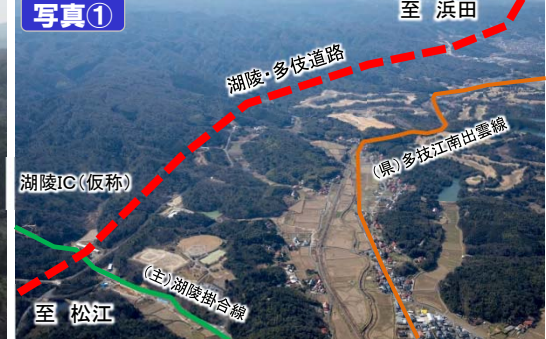
至浜田 湖陵IC(仮称)付近から西を望む