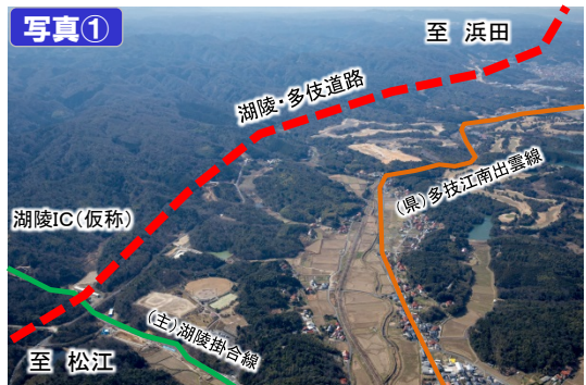
こりょう 湖陵IC (仮称) 付近から西を望む