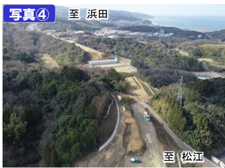
いづも たき 出雲多伎IC