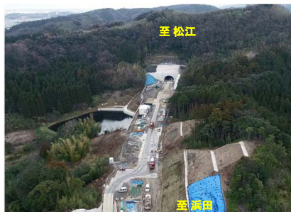
神西トンネル付近